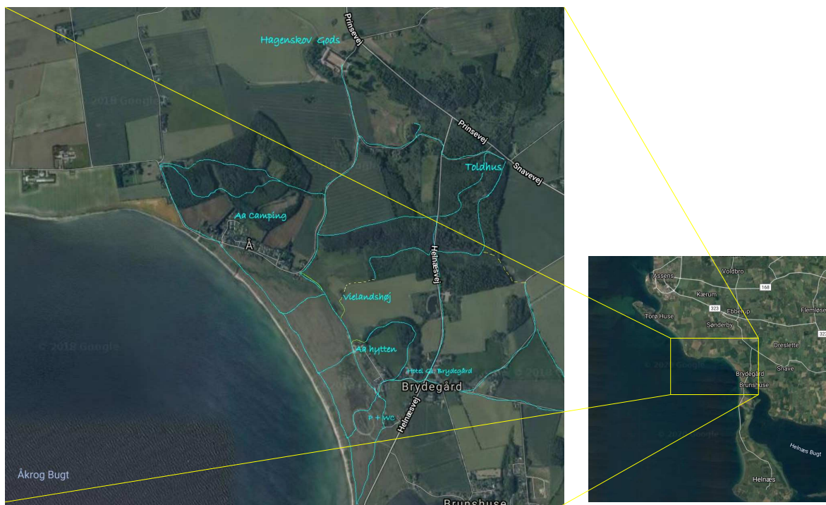
Figur 1: Fortørrelse af oversigtskort af Aakrog bugt, naturområder "Feddet" og Aa å (blå linje) samt stier (lyse blå linjer) og kulturhistoriske mindesmærker.