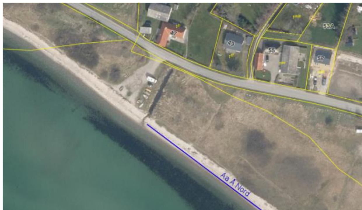
Fig. 3. Matrikelkort med afgrænsning af Aa Å Nord i flg. Assens Kommunes Strandplan.