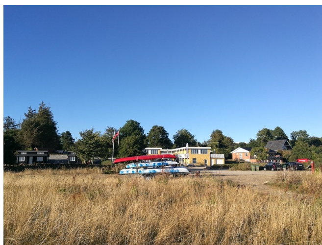
Figur 6: Kajakudlejning på Aa Strand CU@C-Kajakking [13].

Det er en udlejningsform, der indebærer, at man på udlejningssteder langs Fyns kyst kan leje og aflevere kajaker. Når kajakudlejningen er uden betjening giver det større fleksibilitet og lavere lejepriser. Det første skridt var derfor at anskaffe nogle kajaker og få erfaring med udlejning og derefter kontakt med andre udlejningssteder på vestkysten af Fyn og mod det fynske øhav. En af dem er kajak-udlejningen i Strib ( www.strib-kajak.dk ), som allerede har iværksat sådan et "hjælp dig selv" projekt der betyder, at man kan leje kajak på et af tre steder (Middelfart, Strib og Sandager Næs ) og aflevere lejede kajaker på et andet steder.