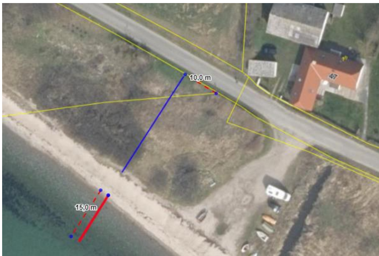
Fig. 2. Matrikelkort med den ændre placering af broen, hvor den er trukket 10 m ind på matr. 3.