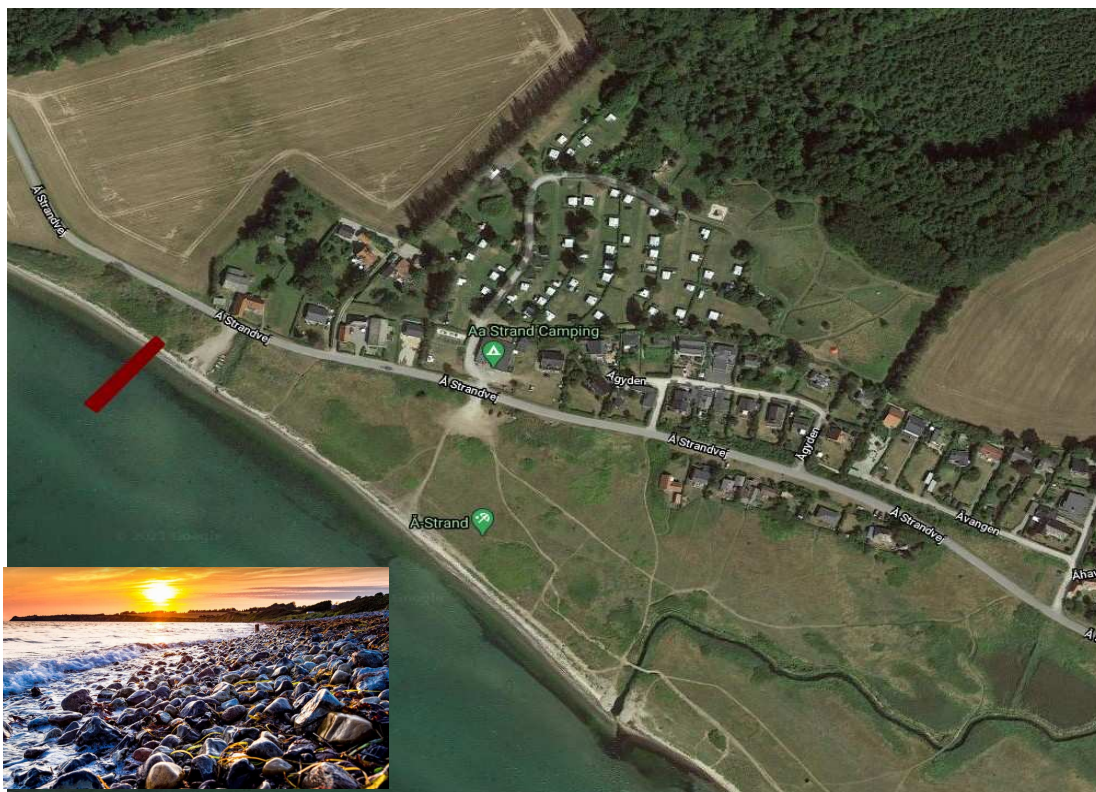
Figure 3: Oversigtskort over Aa Strand med den godkendte placering af bade- og aktivitetsbro (stor billede) og foto af strandforhold mod nord fra Aa åen.

Stranden ud for Aa Strand Camping og den tilhørende parkeringsplads overfor og slæbestedet "Fiskerpladsen" er domineret af en stenbund, som gør det svært for badegæster at bevæge sig ud i vandet. Det gælder også for kajakroere, surfere og SUP 1 er mm. Områdets sandstrand ligger hele 500-800m sydøst for camping-/ parkeringspladsen (se også figur 1) og syd for Aa å. En sådan placering er noget af en udfordring for dem, som skal samle deres fartøjer ved vandkanten som f.eks. vindsurfere, kajakroer, SUPer og sejlere med deres joller.