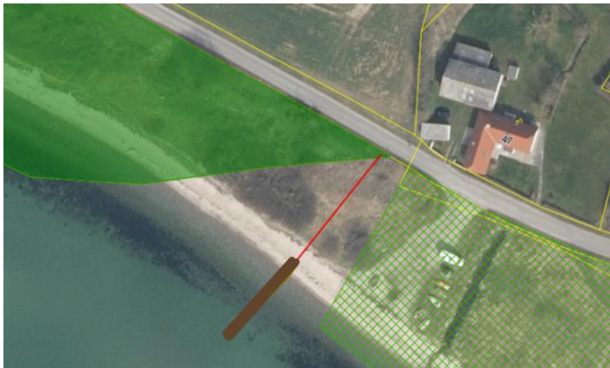
Fig. 1. Kort over ansøgers ønske til den nye bros placering