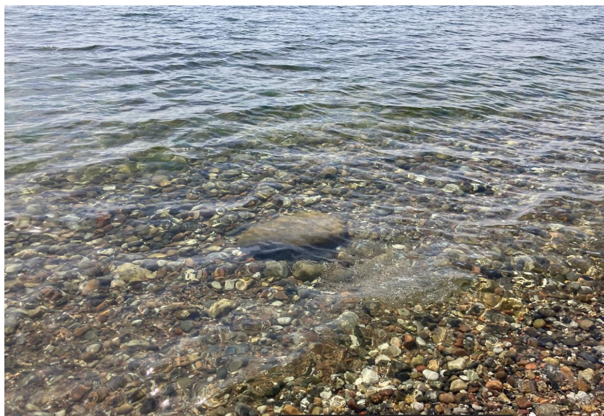
Fig. 4. Stenbund på strand og i vandet omkring det sted broen ønskes etableret.