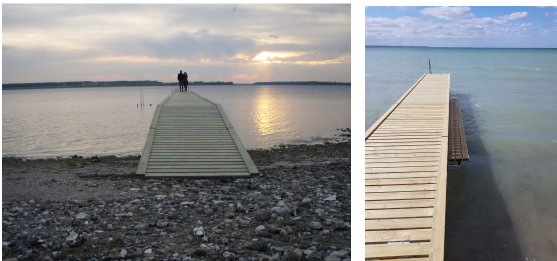
Figur 4: Broeksempel og principtegninger af badebro