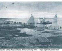
Billedet viser Aa i 1928. Det er omkring 1918 - Optaget er taget som den del af et større fotografi.

ASSENS KOMMUNESAMFUNDS TIDNING - NYHEDSBREVET FRA ASSENS KOMMUNESAMFUND. Den 22. august 1927. Den 22. august 1927. Den 22. august 1927.