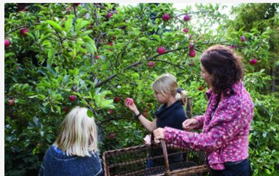
Hav tålmodighed og vent med at plukke dine æbler, til de er helt modne.

Ved du, hvornår og hvordan du skal plukke og opbevare dine æbler, så de holder i mange måneder?