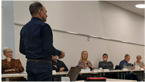
Deltagerne i et tidligere seminar

I samarbejde med SLFs advokat, har SLF sammensat et program, som henvender sig til såvel nye som erfarne bestyrelsesmedlemmer inden for sommer- og fritidshusområdet.